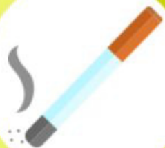
CIGARETA 3 MESIACE - 2 ROKY