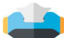
PAPIEROVÁ VRECKOVKA 3 MESIACE