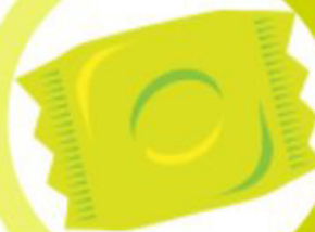
ŽUVAČKA 5 ROKOV