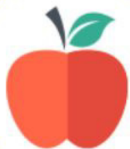
OHRYZOK JABLKA NIEKOĽKO TÝŽDŇOV