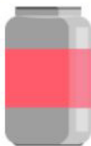
PLECHOVKA 20 - 100 ROKOV